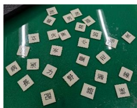
漢字カードをタッチ