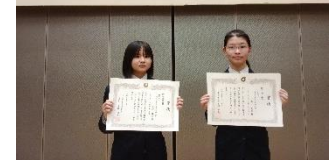
人権尊重推進月間児童・生徒作品表彰式

作文部門 市長賞 3年2組 ●● ●● さん 努力賞 3年2組 ●● ●● さん ポスター部門 教育長賞 3年2組 ●● ●● さん 努力賞 3年1組 ●● ● さん 標語部門 教育長賞 2年2組 ●● ●● さん 努力賞 1年1組 ●●● ●● さん